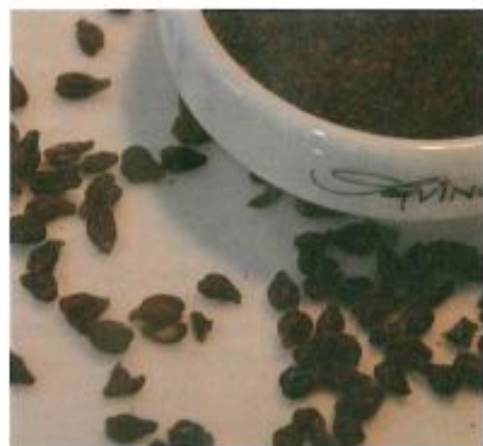
Traubenkerne werden zu Pflegeprodukten verarbeitet.